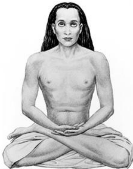
Babaji, tal como aparece en "Autobiografía de un Yogui"

El Kriya Yoga de Babaji es un linaje o un sendero de Yoga, de los muchos que existen, que proviene, como su nombre indica, de un gran maestro de Yoga conocido como "Babaji". La primera vez que supimos de Babaji en Occidente fue a través del libro "Autobiografía de un yogui" de Paramahansa Yogananda, publicado por primera vez en Estados Unidos en 1946. El capítulo XXXIII del libro describe a un maestro inmortal que mora cerca del valle de Badrinath, Himalayas, que retiene siempre el aspecto de un joven.